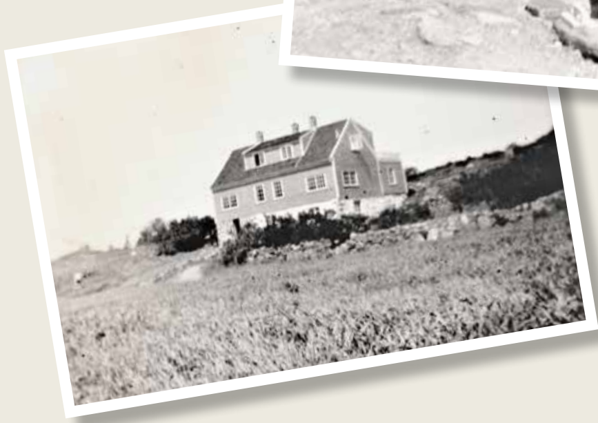
Fra Sumatra i 1934